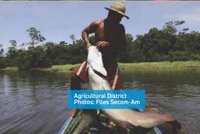
Agricultural District