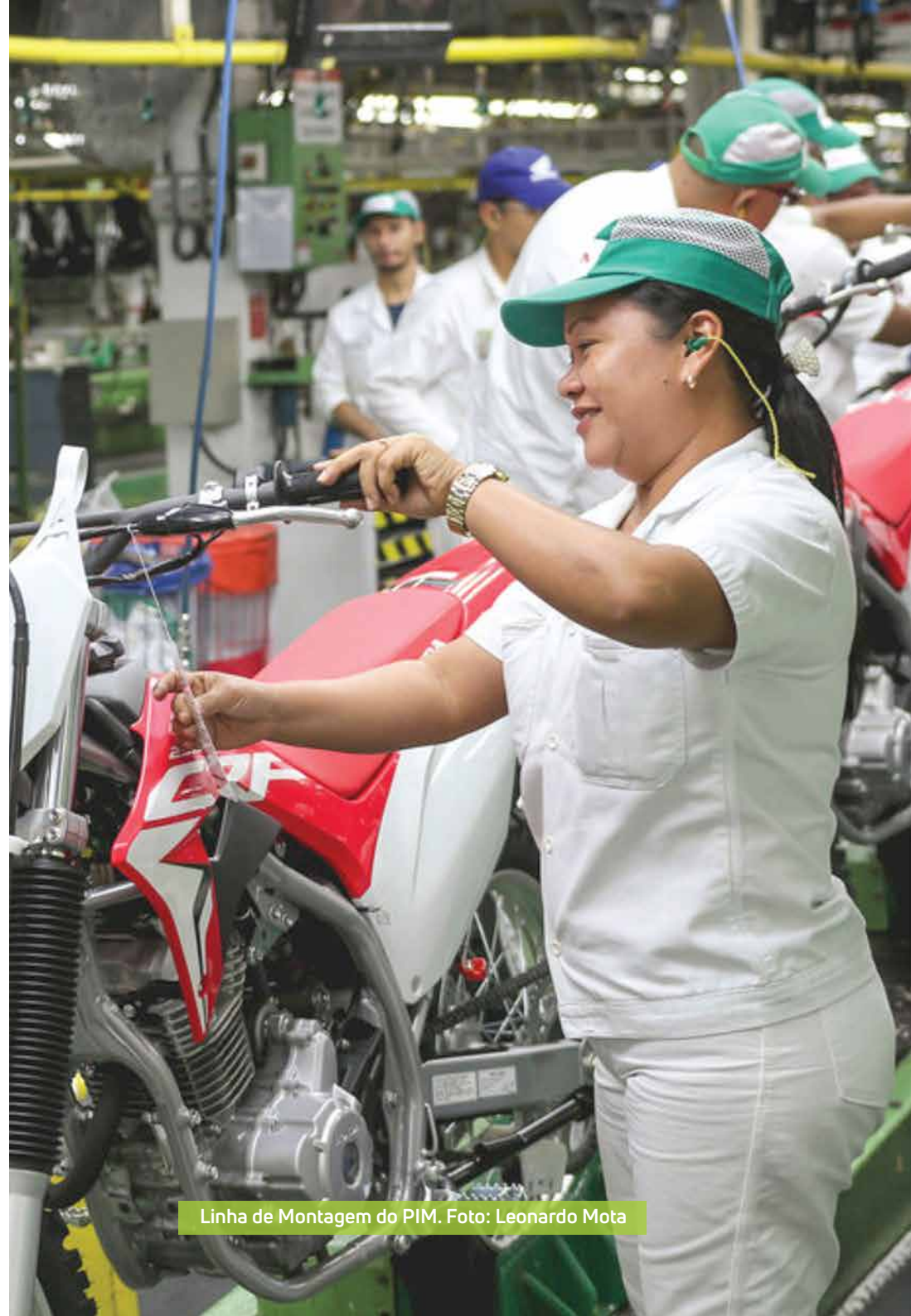
Linha de Montagem do PIM.