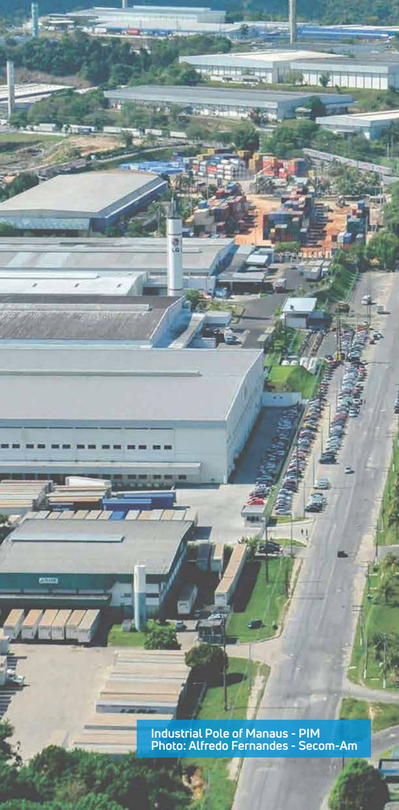
Industrial Pole of Manaus - PIM