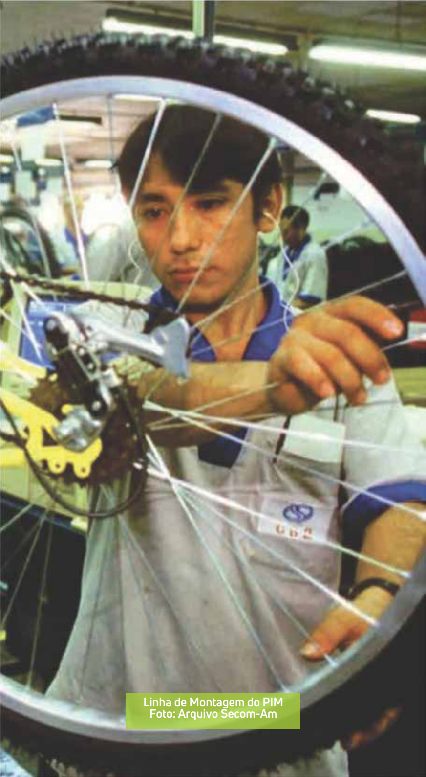
Linha de Montagem do PIM