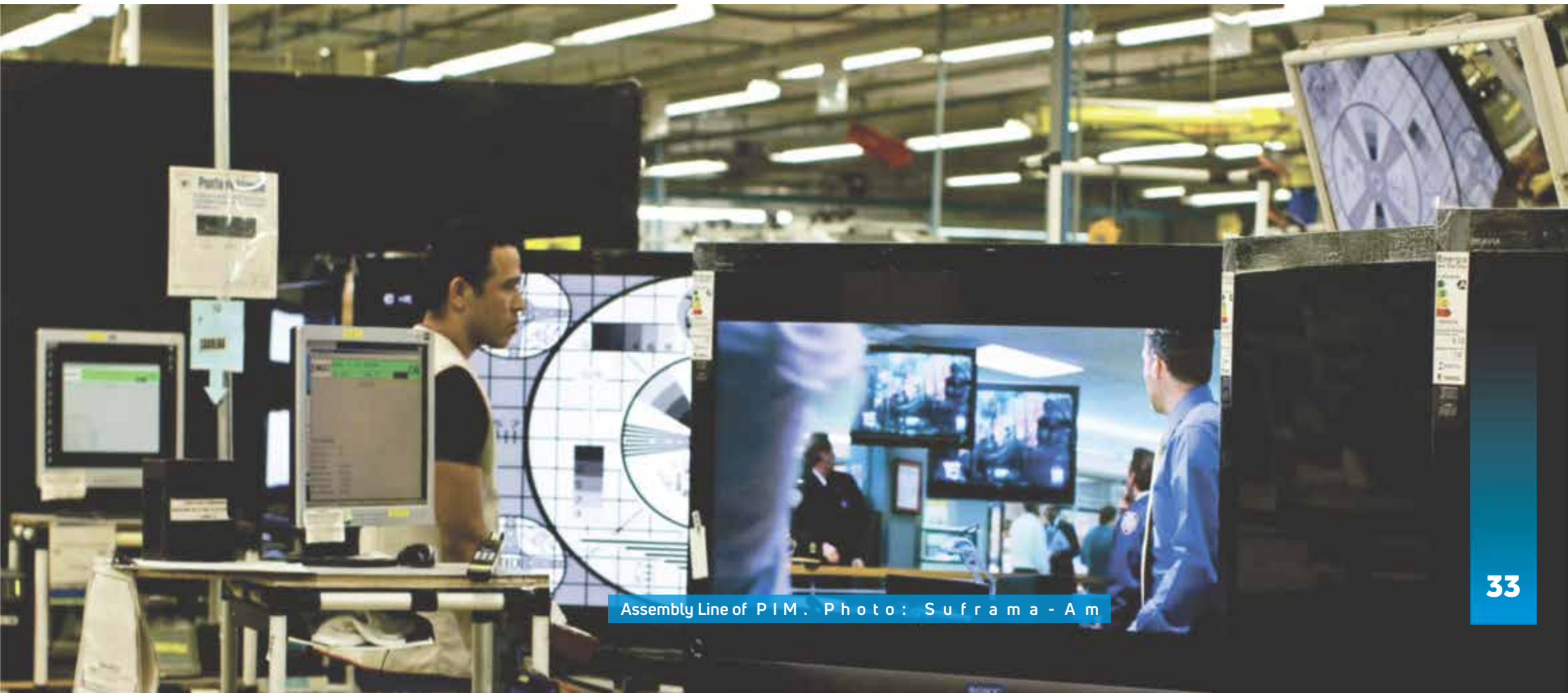
Assembly Line of PIM.

ZFM offers the most favorable conditions for the success of productive initiatives, such as legal certainty and stability and respect for the environment to all those who, like the Amazonian people, seek to establish sustainability and thrive from within the planet's largest jungle.