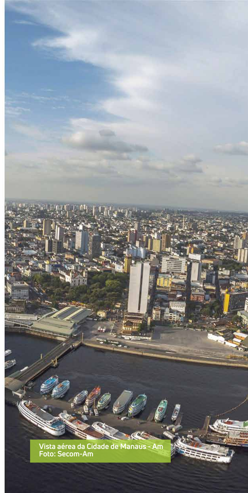
Vista aérea da Cidade de Manaus - Am

Conta, ainda, com uma diversificada rede hoteleira, tanto urbana quanto de selva; um moderno aeroporto internacional e movimentados centros comerciais onde é oferecida uma extensa gama de produtos e serviços, sem mencionar a atrativa culinária regional.