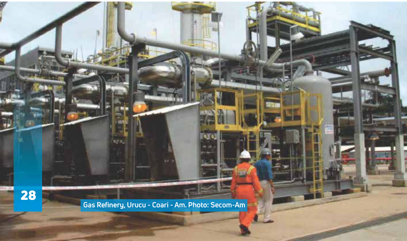
Gas Refinery, Urucu - Coari - Am.

The production of tin, gold, tantalite, oil, clay and gas is already a reality. Recently identified gas reserves in areas close to the capital will enable cheaper electricity to be made, which will be available steadily and at more competitive prices for the Industrial Hub consumption.