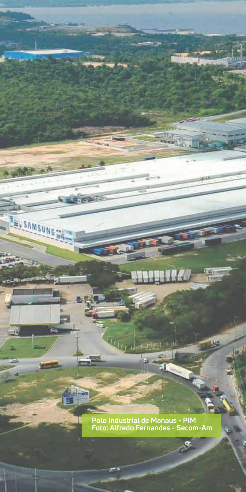
Polo Industrial de Manaus - PIM