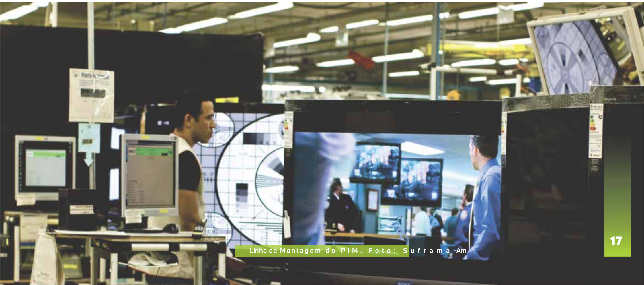
Linha de Montagem do PIM.

A ZFM oferece as mais favoráveis condições para o sucesso de iniciativas produtivas, como a segurança jurídica e estabilidade e respeito ao meio ambiente, a todos aqueles que, à semelhança do povo amazônico, buscam estabelecer sustentabilidade e prosperar na maior oresta do planeta.