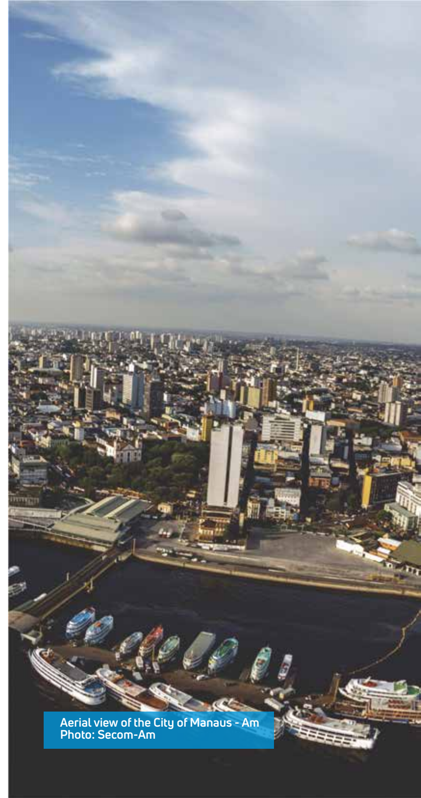
Aerial view of the City of Manaus - Am

It also has a diverse hotel network, both urban and jungle; a modern international airport and busy shopping centers where an extensive range of products and services are offered, not to mention an attractive regional cuisine.