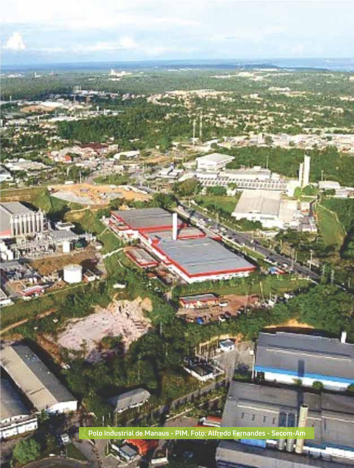
Polo Industrial de Manaus - PIM.